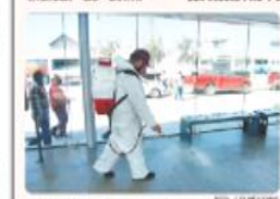
TIJUANA. Estos medidas también se implementarán en las estaciones del SITV y los mercados sobre ruedas.